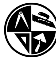
Fliesen- Platten und Mosaikleger/in