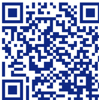
Fliesen-, Platten- und Mosaikleger/in