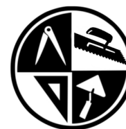
Fliesen-, Platten- und Mosaikleger/in